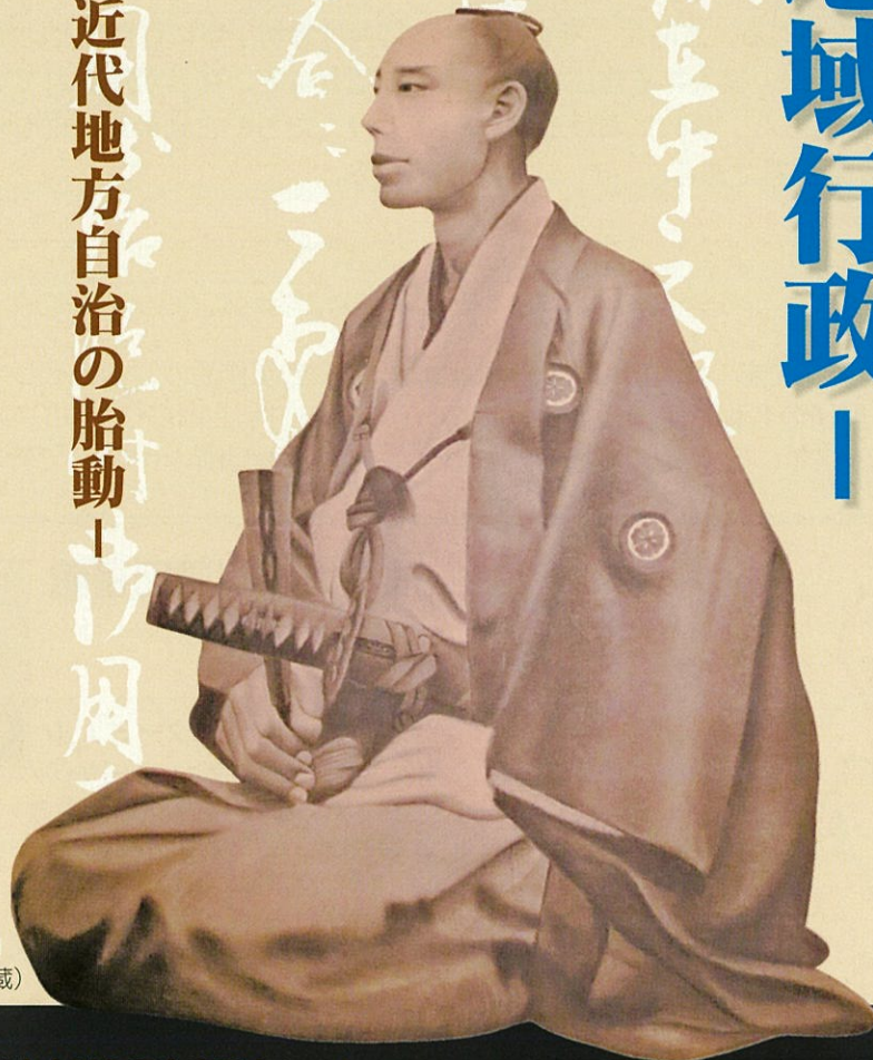
古閑忠右衛門 肖像画(個人蔵)