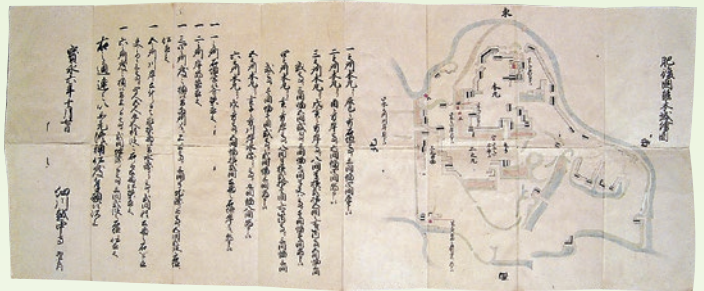
「肥後国熊本城絵図」 宝永6年10月7日 (永青文庫)

江戸時代の城修復には幕府の許可が必要だった。本文書は三代将軍家光期の老中・松平信綱らが細川忠利に宛てて熊本城と八代城の普請を許可した文書。寛永17(1640)年8月の大雨で両城の石垣が破損した。熊本城は本丸東方石垣の根石の際に石を並べて補強する普請が、八代城は本丸北方石垣を築き直す普請が、それぞれ許可されている。地震だけでなく洪水による石垣破損への対応は、当時の大名たちにとって大きな課題であった。